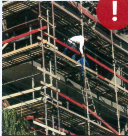
العمل بدون معدات وقاية للمحماية الشخصية