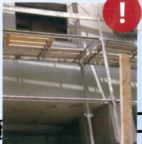
سقالات بحالة غير سليمة