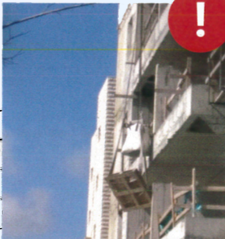
رفع معدات بطريقة غير سليمة