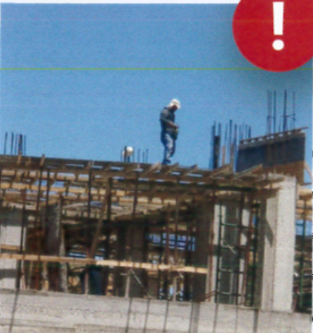
عمل على ارتفاع بشكل غير سليم