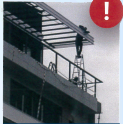
العمل بشكل غير سليم على السلم