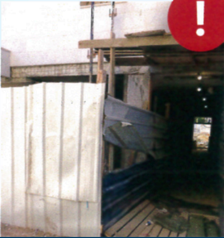
جدار بحالة غير سليمة في موقع البناء

انتم أيضا يمكنكم منع وقوع الحادث التالي! هل رأيتم مخاطر؟